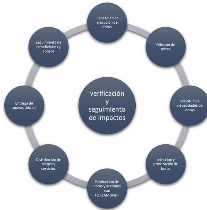
FIGURA 1. MODELO GENERAL DE PROCESOS SEGUIDOS

En consecuencia a lo anterior, el grado de consolidación operativa del FORTAMUNDF, permite reconocer que 1) no existen documentos que normen los procesos del FORTAMUNDF; 2) los operadores de los procesos están documentados respecto a la aplicabilidad del FORTAMUNDF en obras; 3) los procesos están estandarizados respecto a la planeación de obras; 4) se cuenta con un sistema de monitoreo e indicadores de gestión que retroalimenten los procesos operativos por medio de sistemas de información aplicativos; 5) No se cuenta con mecanismos para la implementación sistemática de mejoras. Por lo anterior, consolidación operativa del FORTAMUNDF es de menor alcance comparado con el FORTAMUNDF como otra fuente de financiamiento de obras para el Municipio.