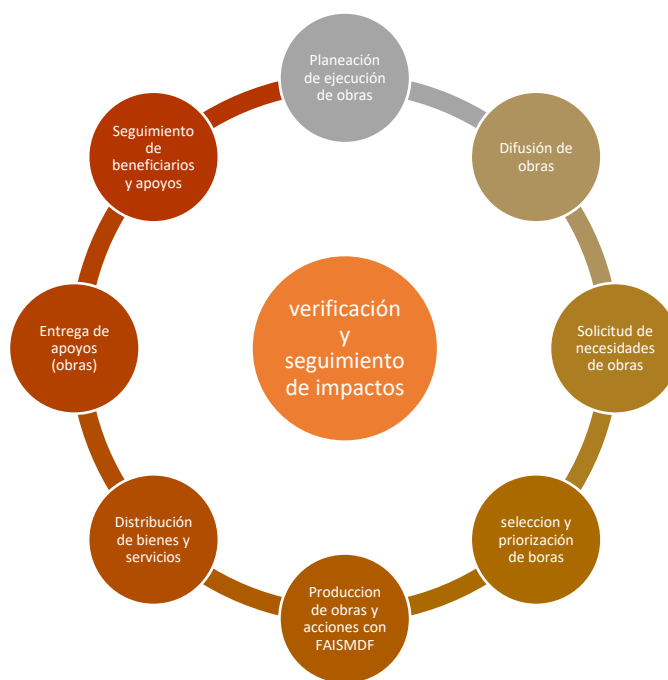
FIGURA 1. MODELO GENERAL DE PROCESOS SEGUIDOS

En consecuencia a lo anterior, el grado de consolidación operativa del FAISMUN, permite reconocer que 1) si existen documentos que normen los procesos del FAISMUN; 2) los operadores de los procesos están documentados respecto a la aplicabilidad del FAISMUN en obras –obras públicas municipales-; 3) los procesos están estandarizados respecto a la planeación de obras; 4) se cuenta con un sistema de monitoreo e indicadores de gestión que retroalimenten los procesos operativos por medio de sistemas de información aplicativos; 5) se cuenta con mecanismos para la implementación sistemática de mejoras. Por lo anterior,